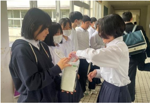
能登半島地震募金活動

陵南中学校生徒会では、校内外のボランティア活動に力を入れています。早速、環境ボランティア委員会が放課後に花の植栽作業を行いました。さらに復興がなかなか進まない能登半島地震に対する募金を全校生に呼びかけました。今後は校外（地域）でのボランティア活動も実施する予定です。